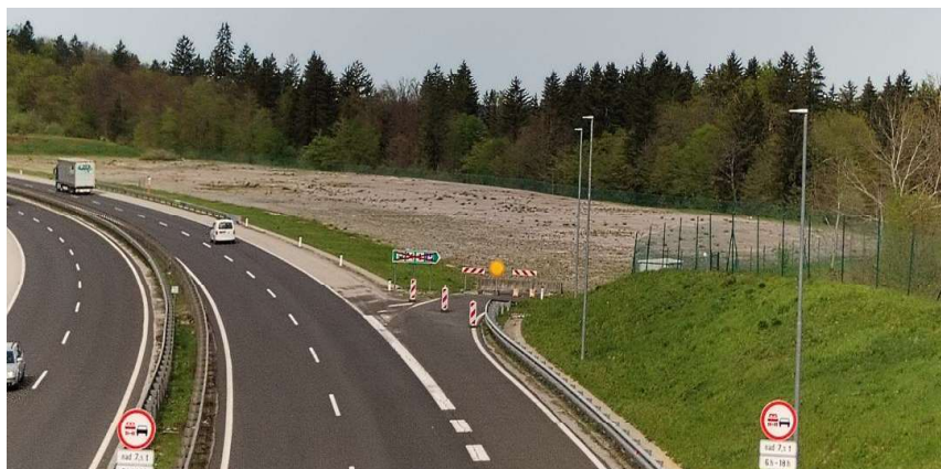
Slika 2: Obstoječe gramozni plato bodočega počivališča Grm

Počivališče Grm je delno zgrajeno kot utrjen gramozni plato po Državnem lokacijskem načrtu za avtocesto na odseku Pluska-Ponikve (Uradni list RS, št. 78/06, v nadaljevanju: DLN), kjer je predvideno da bi obsegalo oskrbno postajo (bencinski servis, gostinski objekt, parkirne površine za osebna, potniška in tovorna vozila ter zelene površine). Obstoječi plato že ima urejen dovoz in izvoz na avtocesto ter delno komunalno opremljenost, vključno z javno razsvetljavo in telekomunikacijskim omrežjem. V neposredni bližini se nahajajo tudi elektroenergetski vodi, komunikacijsko omrežje in avtocestna meteorna kanalizacija. Vsa zemljiške parcele znotraj DLN so v lasti družbe DARS, d. d.