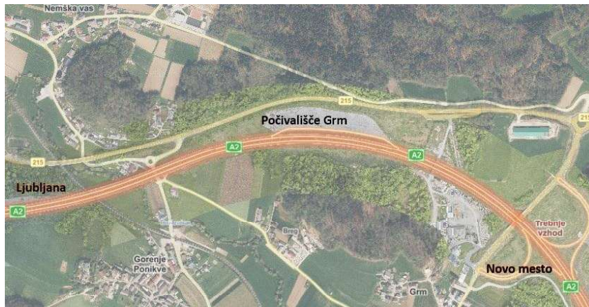
Slika 1: Obstoječe počivališče Grm na AC A2 smer Novo mesto – Ljubljana, odsek Bič -Trebnje vzhod, za izvozom Trebnje vzhod

Na podlagi pregleda avtocestnega omrežja je bila prepoznana možnost ureditve obstoječega platoja, predvidenega za načrtovano počivališče Grm na avtocesti A2 v smeri Novo mesto – Ljubljana, na odseku Bič – Trebnje vzhod (odsek 0672), med stacionažama km 13,998 in km 13,639 (Slika 1).